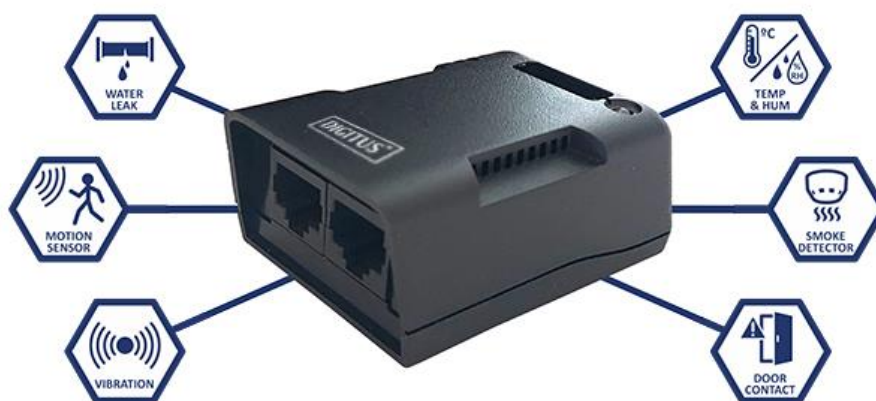
Zewnętrzny moduł parametrów środowiskowych